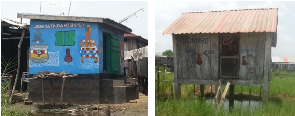
Image 3 : 3-a : Temple de divinité Sakpata 3-b : Temple de divinité Dan

A Dokomè, la population riveraine vénère les divinités AHOUANTCHINKO , TODAN et AHITONOU . Ce sont des divinités protectrices, de la guerre et de pourvoyeurs de richesse et de bien-être des autochtones.