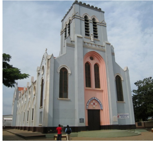
5.b La basilique de Ouidah

Le temple des Pythons est un sanctuaire vodun. A Ouidah la population vénère le python qui est une divinité qui protège la ville.